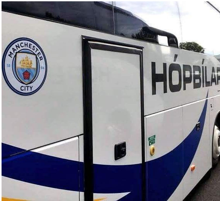
Sannkallað meistarasarstarf hér á ferð.